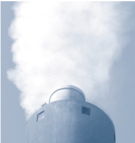
Umweltorientiertes Handeln ist eine klar definierte Managementaufgabe in den Betrieben der Aluminiumindustrie.

Die Aluminiumindustrie begleitet Ökobilanzprojekte wissenschaftlicher Institutionen wie auch von Kunden und trägt