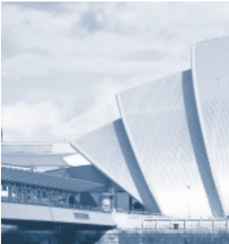
Aluminiumprodukte im Bausektor schaffen eine Synthese aus hoher Funktionalität, Ästhetik und Design.