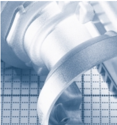
Aluminium ermöglicht eine Kreislaufwirtschaft ohne Qualitätsverluste.

Mit der Einführung des Dualen Systems Deutschland wurde im Verpackungssektor ein flächendeckendes System der Erfassung, Sortierung und Verwertung auch von Aluminiumverpackungen auf-